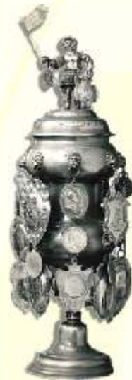
Willkommensgruß der Riemerinnung

Geschenk zur „Erhebung“ des Königs von Schweden in den Sattler- oder Riemerstand