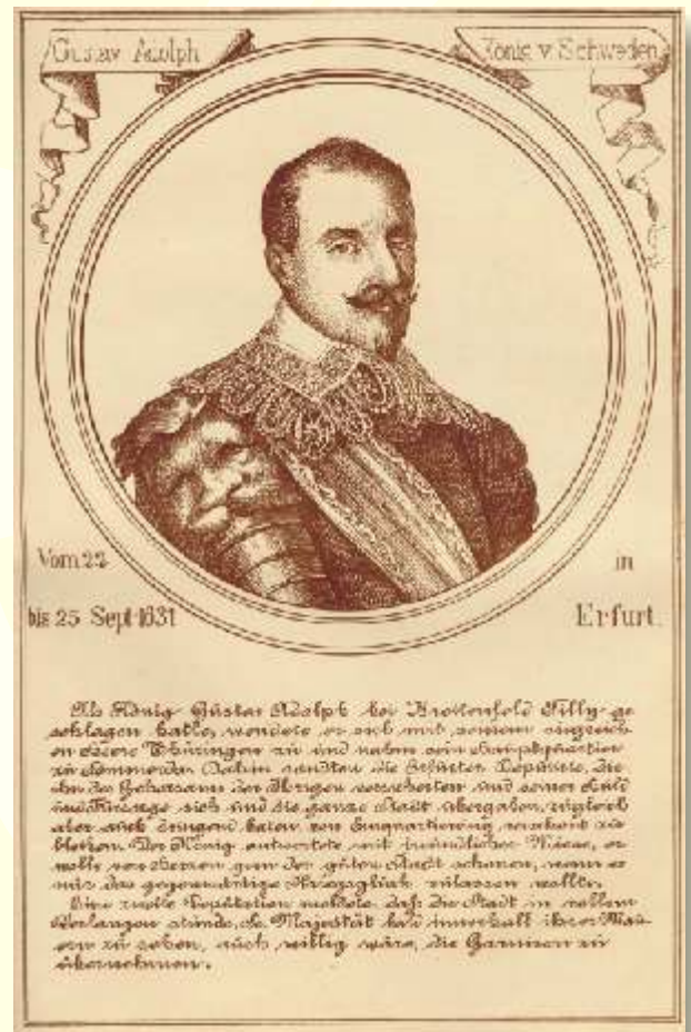
Porträt von GUSTAV II. ADOLF

Der König von Schweden (1611 - 1632) nahm 1631 in der Hohen Lilie Quartier, 1632 mit seiner Frau MARIE ELEONORE.